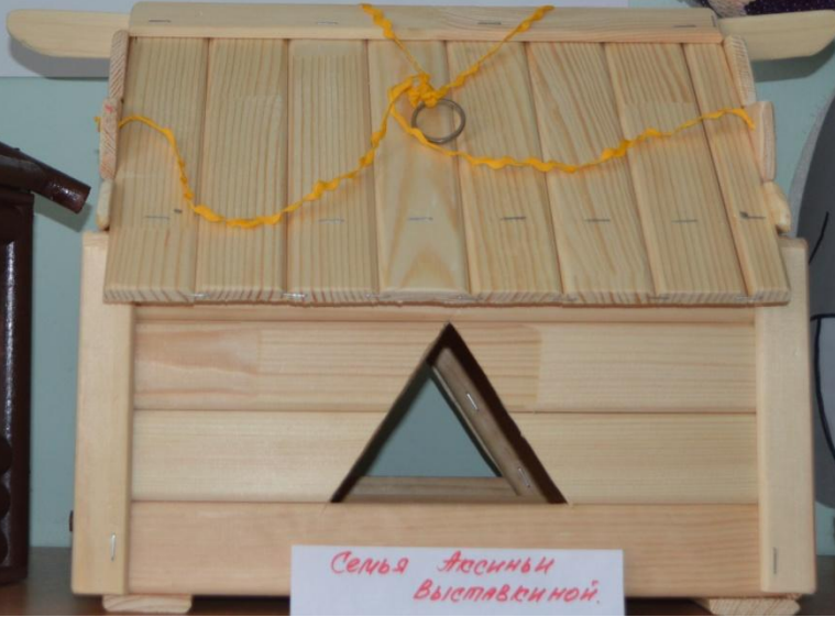
Семья Аюснны Выставленной.