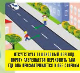
ОТСУТСТВУЕТ ПЕШЕХОДНЫЙ ПЕРЕХОД, ДОРОГУ РАЗРЕШАЕТСЯ ПЕРЕХОДИТЬ ТАМ, ГДЕ ОНА ПРОСМАТРИВАЕТСЯ В ОБЕ СТОРОНЫ