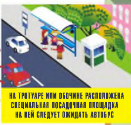
НА ТРОТУАРЕ ИЛИ ОБОЧИНЕ РАСПОЛОЖЕНА СПЕЦИАЛЬНАЯ ПОСАДОЧНАЯ ПЛОЩАДКА НА НЕЙ СЛЕДУЕТ ОЖИДАТЬ АВТОБУС