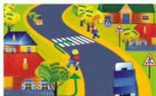
ПО ОБОЧИНЕ ДОРОГИ СЛЕДУЕТ ИДТИ НАВСТРЕЧУ ДВИЖЕНИЮ ТРАНСПОРТА