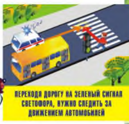
ПЕРЕХОДИ ДОРОГУ НА ЗЕЛЕНЫЙ СИГНАЛ СВЕТОФОРА, НУЖНО СЛЕДИТЬ ЗА ДВИЖЕНИЕМ АВТОМОБИЛЕЙ