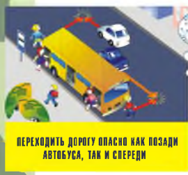
ПЕРЕХОДИТЬ ДОРОГУ ОПАСНО КАК ПОЗАДИ АВТОБУСА, ТАК И СПЕРЕДИ