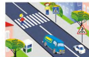
НАЗЕМНЫЙ ПЕШЕХОДНЫЙ ПЕРЕХОД ОБОЗНАЧАЕТСЯ СПЕЦИАЛЬНЫМИ ДОРОЖНЫМИ ЗНАКАМИ И РАЗМЕТКОЙ

Вот обычный переход. По нему идёт народ. Здесь специальная разметка, «Зеброю» зовётся метко! Белые полоски тут Через улицу ведут! Знак «Пешеходный переход» Где на «зебре» пешеход, Ты на улице найди И под ним переходи!