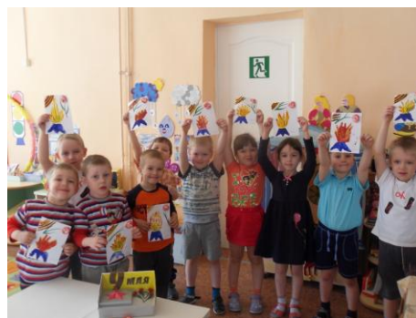
Поэтический вечер ко Дню Победы

Благодарим, солдаты, вас За жизнь, за детство и весну, За тишину, за мирный дом, За мир, в котором мы живем!