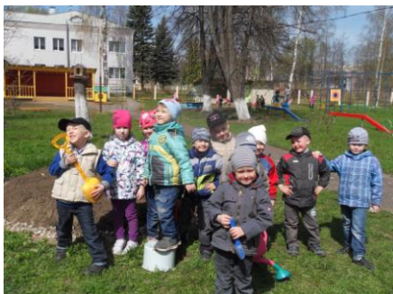
Труд детей на огороде и цветнике