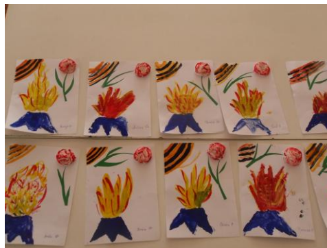
творческие работы детей ко Дню Победы