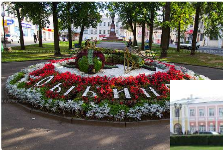
Клумба с рыбой и надписью "рыбинск"